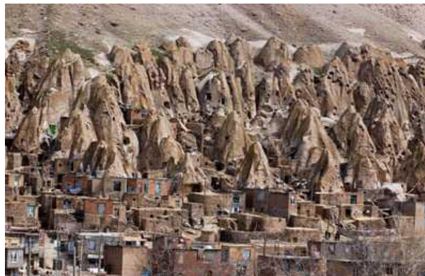
شکل ۱: روستای کندوان، معماری صخره‌ای